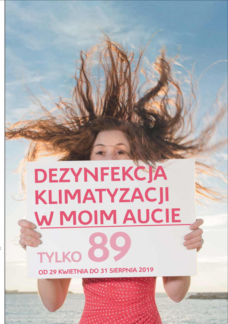
Projekt Mazowiecka Kompania Reklamowa, Kwiecień 2019.